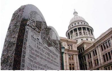
De ti bud foran State Capitol i Austin, Texas.

Bud fem til syv forbyder mord og tyveri og utroskab. Men rangerer utroskab (det sjette bud) virkelig på linje med drab og røveri?